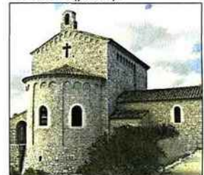
► La chapelle de Pise.